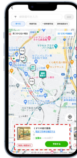
③近隣で在庫がある可能性の高い薬局が表示