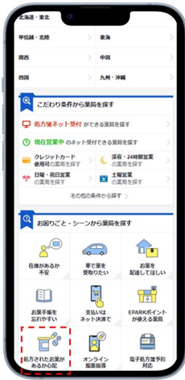
①お困りごと・シーンから薬局を探すの「処方されたお薬があるか心配」をタップ