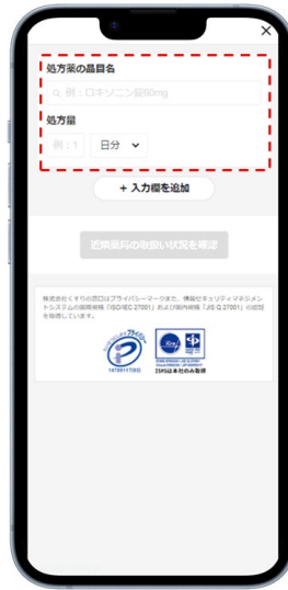
②処方された品目名・処方量を入力